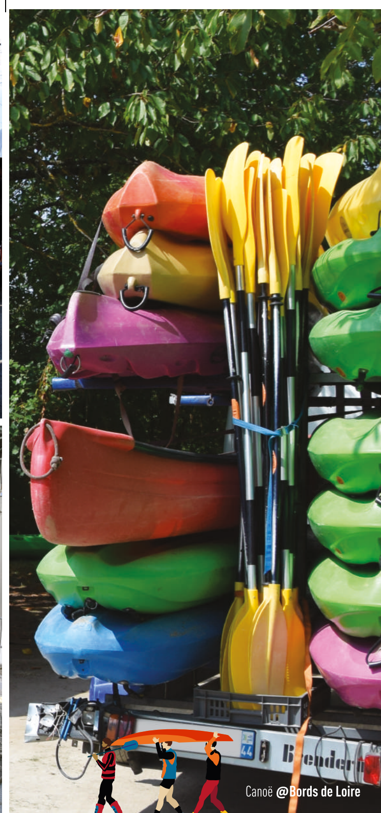
Canoe @Bords de Loire