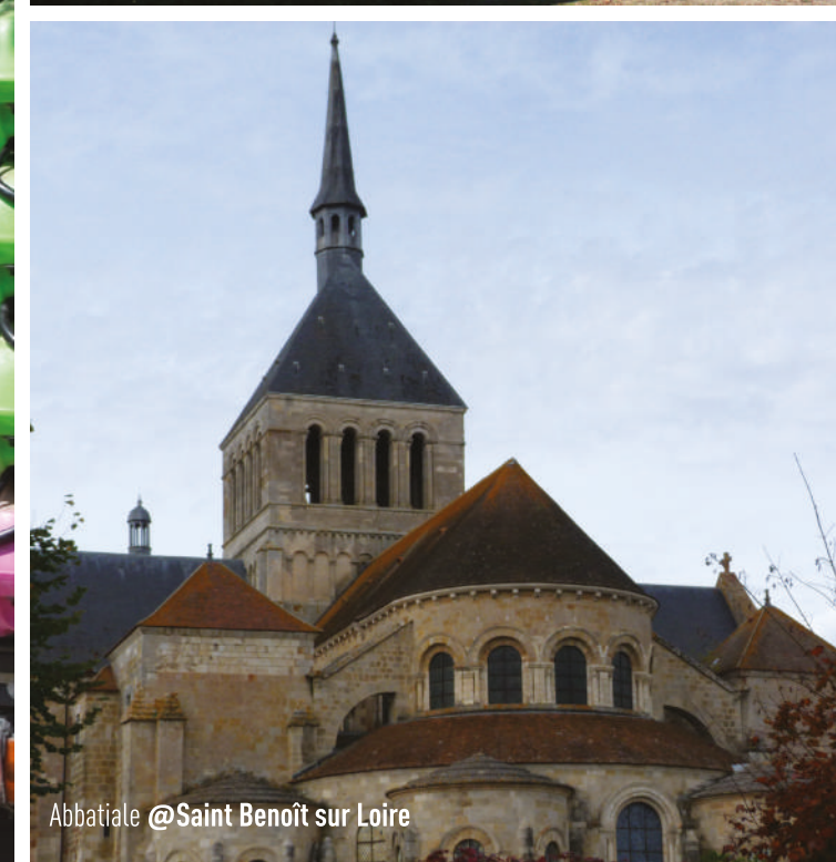
Abbatiale @Saint Benoît sur Loire