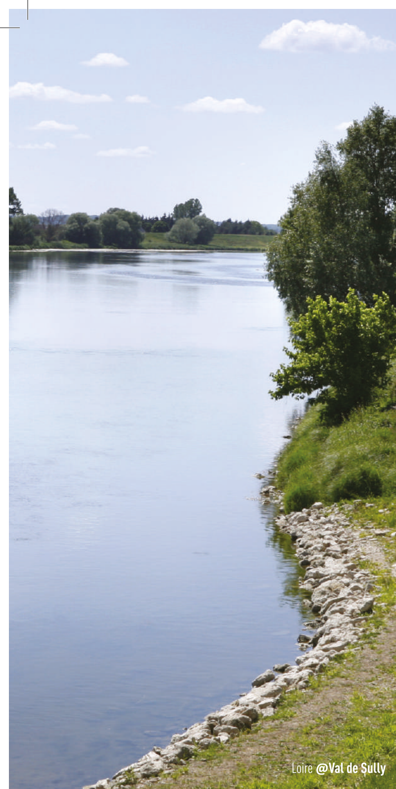
Loire @Val de Sully