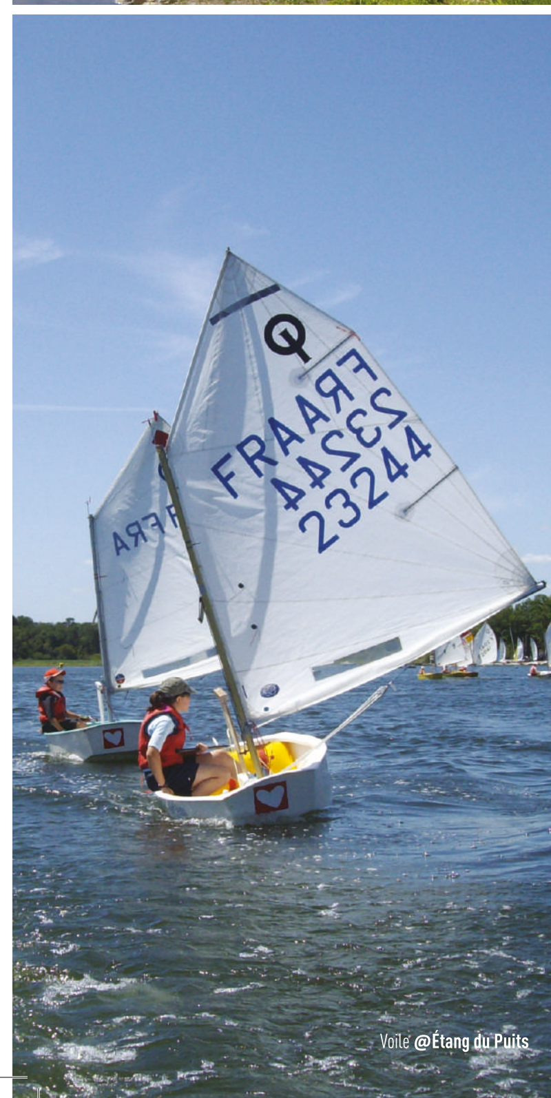
Voile @Étang du Puits