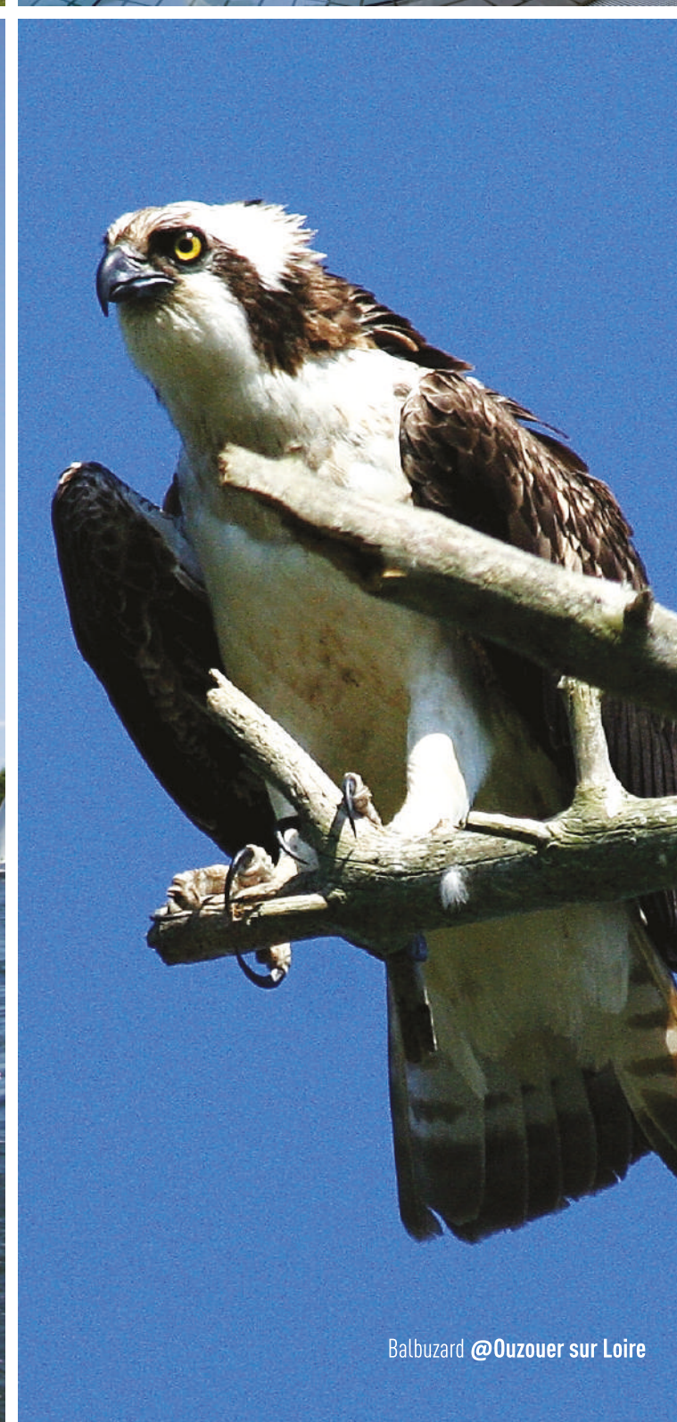
Balbusard @Ouzouer sur Loire

#ValdeSully Retrouvez tous les lieux dans le guide touristique + de richesses.