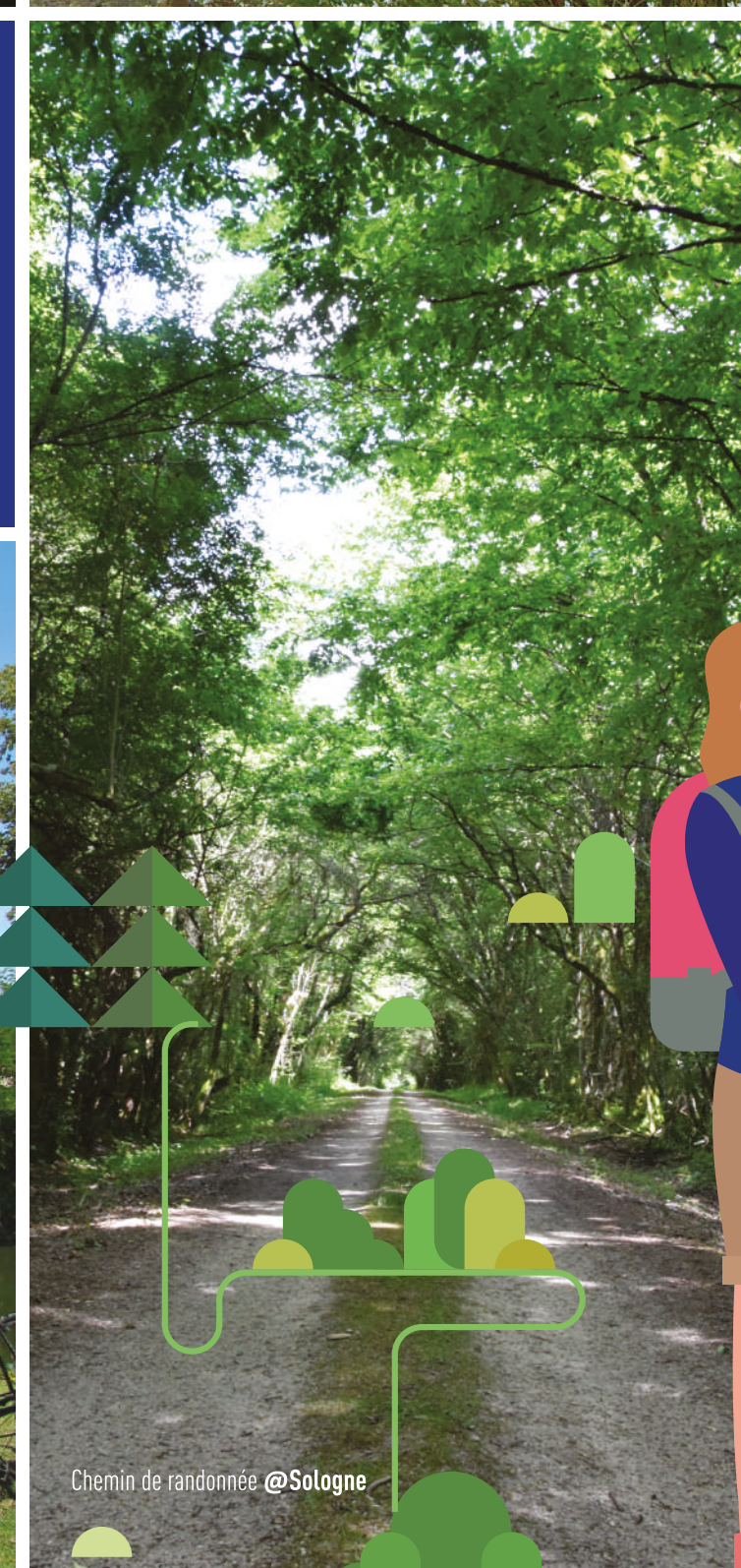
Chemin de randonnée @Sologne