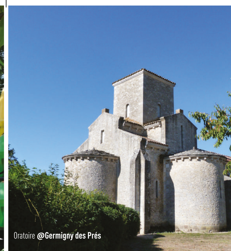
Oratoire @Germigny des Prés