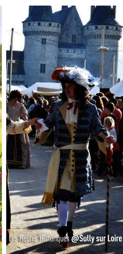
Les Heures Historiques @Sully sur Loire