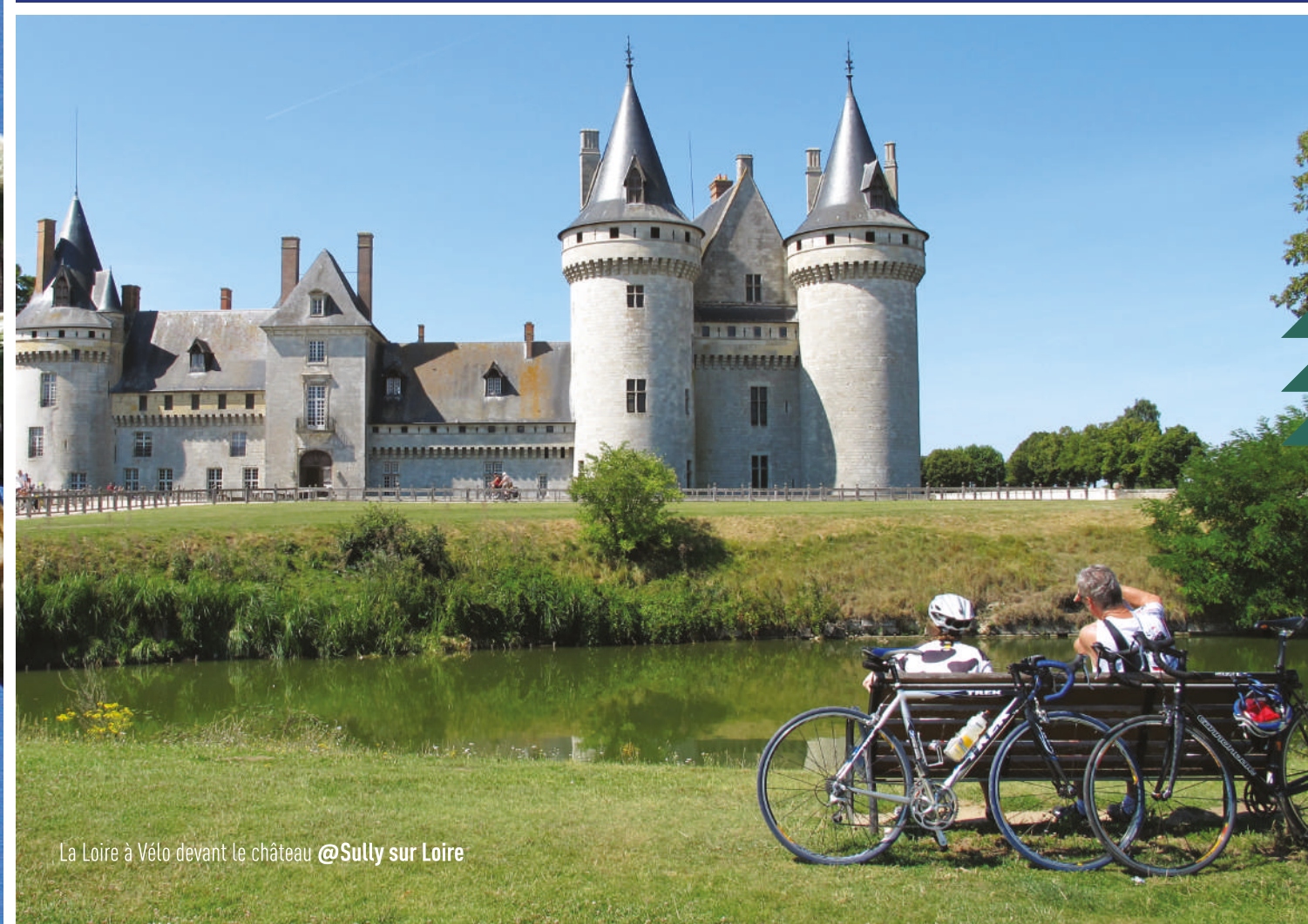
La Loire à Vélo devant le château @Sully sur Loire

#ValdeSully Retrouvez tous les lieux dans le guide touristique + de richesses.