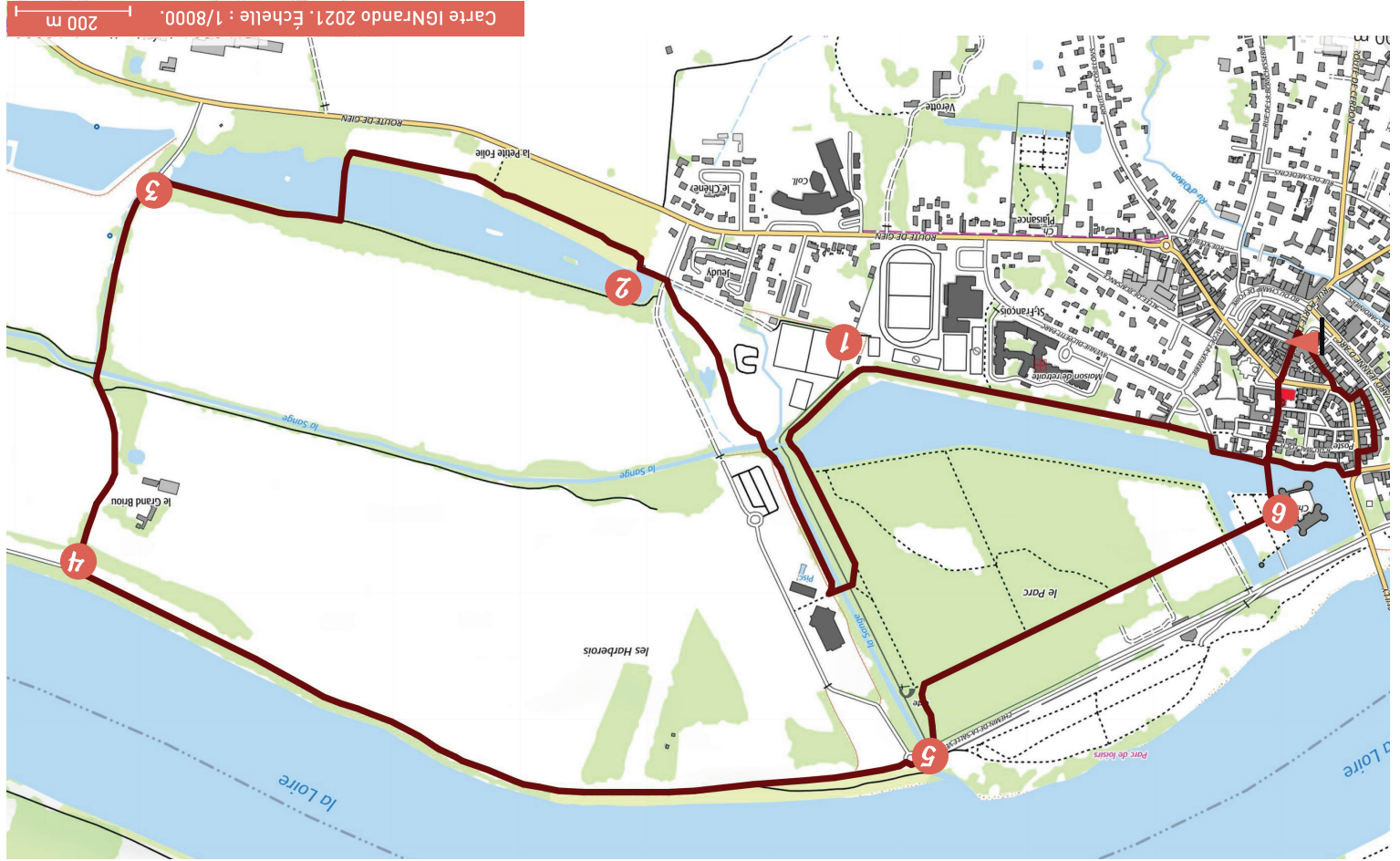
Carte IGNrando 2021. Echelle : 1/8000. 200 m